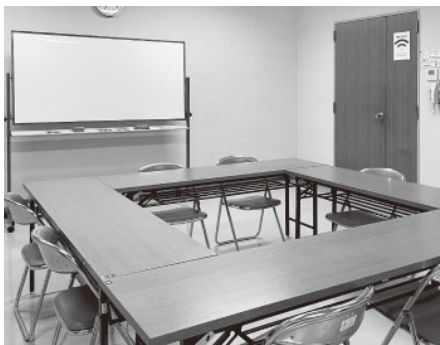
【第1・2会議室】 各部屋10名程度

料金の詳細や貸出時間等に関しては当所ホームページに記載しております。ご不明な点は総務課までお気軽にお問い合わせください。