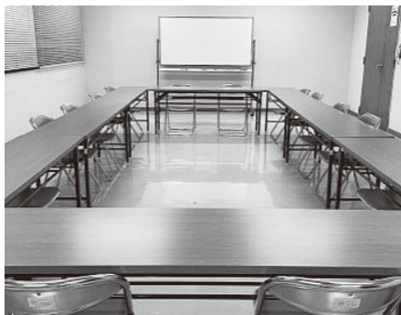
【第1・2会議室連結】 20～25名程度