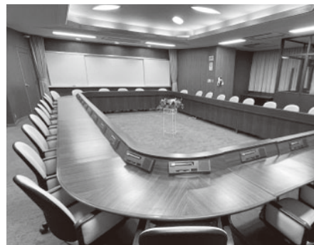
【議員会議室】 25名程度